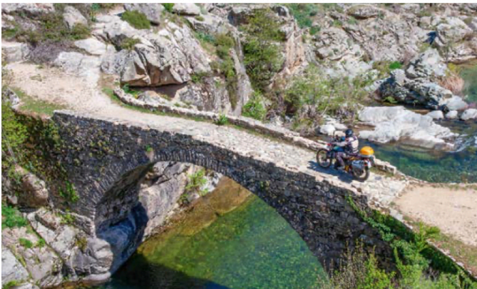
Abseits der asphaltierten Strecken lässt sich so manches entdecken.