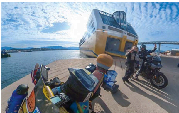
Entspannt: Mit der Nachtfähre nach Ajaccio.