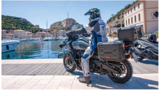
Abstecher zum Hafen von Bonifacio.

de Bavella. Die bizarr geformten Felsspitzen des Aigulles de Bavella werden auch die Dolomiten Korsikas genannt und sind Ziel zahlreicher Wanderwege. Immer wieder durchfahren wir Gebiete, wo sich grobe Spuren von Waldbränden langsam erholen und neues Grün hervorbringen. In Sartène gönnen wir uns in der imposanten Altstadt eine Erfrischung. Von Porto Vecchio geht's weiter Richtung Süden.