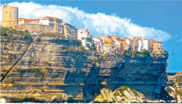
Bonifacio mit ihrer über die Klippen ragenden Altstadt und Zitadelle.