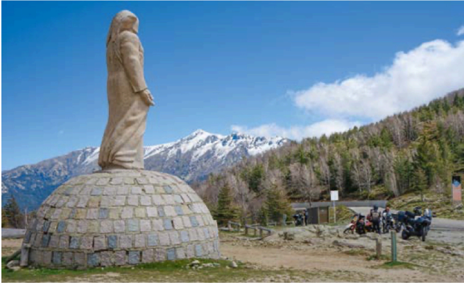
Der Col de Vergio ist mit 1.470 Metern die höchste Passstraße Korsikas.