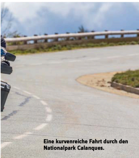
Eine kurvenreiche Fahrt durch den Nationalpark Calanques.

Unsere Tagesetappe endet am Kevano Plage, den wir nach kurvenreicher Topografie erreichen.