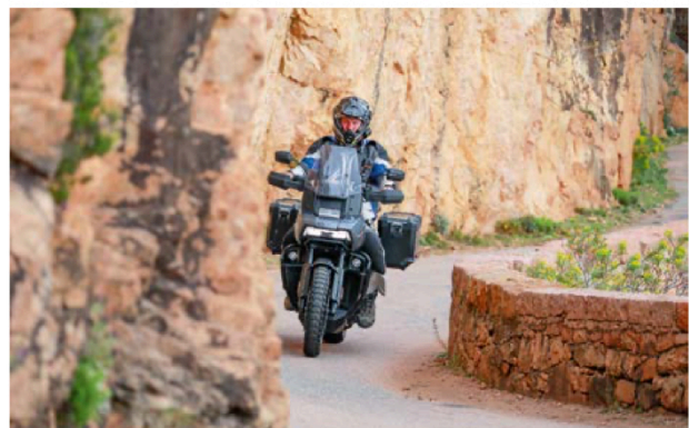
Korsika bietet endlos erscheinende Kurvenfolgen und abwechslungsreiche Fahrprofile.