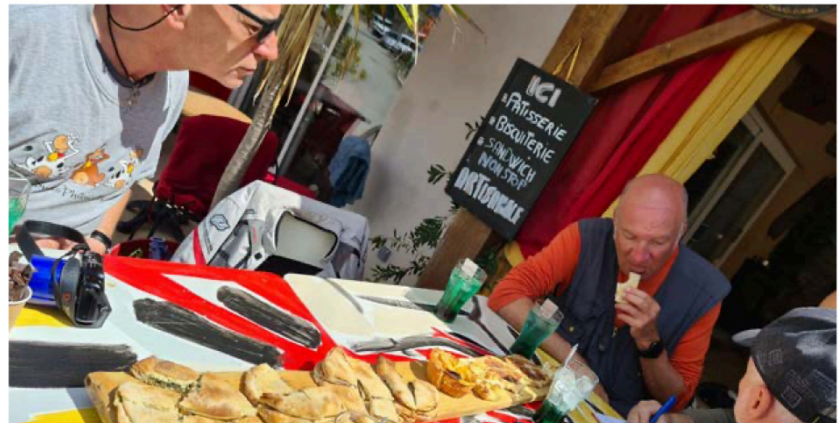
Auch die typisch korsischen Spezialitäten kommen nicht zu kurz.