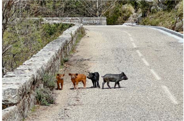
Auf Korsika ist immer mit freilaufenden Tieren auf der Straße zu rechnen.