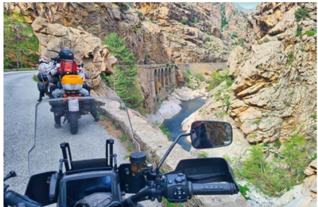
Fotostopp in der Scala Di Santa Regina Schlucht.

Unsere zweite Etappe führt uns einmal diagonal durch Korsika in nordöstliche Richtung: Über den Col de Vergio (1.470 Meter), der höchsten Passstraße Korsikas, und in das Tal des Aitone. Der Aitone bietet mit seinen durch Wasserkraft und Sedimenten glattgeschliffenen Felsbrocken zahlreiche Flussbadestellen, sog. Gumpen. Jetzt im April nett anzusehen, aber noch etwas zu frisch für uns Warmduscher. Unsere Fahrstrecke ist gesäumt von zahlreichen schneebedeckten Berg-