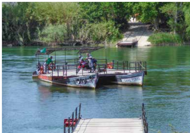
Abenteuerlich: Pas de barca de Miravet, die Überfahrt über den Ebro.