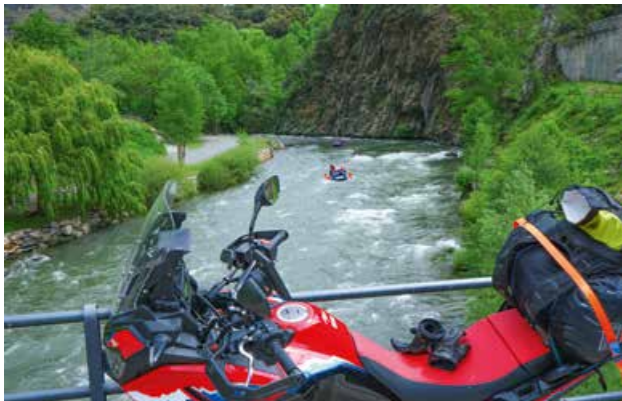
Paddler auf der Noguera bei Rialp.