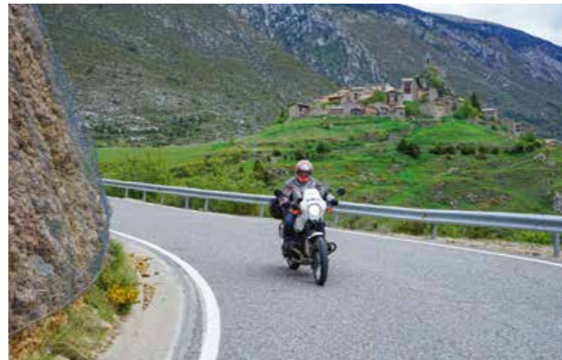
Motorradfahren in Katalonien ist klasse.

Rest des Weges auf der N260 zu unserem heutigen Etappenziel La Seu d'Urgell. Unser kleines Hotel liegt unmittelbar am Rande der Altstadt. Die Straße hat einen parkähnlich angelegten Mittelstreifen zwischen den Richtungsfahrbahnen und gibt uns die Möglichkeit die Nachmittagssonne neben einem Kaffee zu genießen. Unsere Seele baumelt noch als wir freundlichst mit Hinweis auf unsere Motorräder angesprochen wurde. Dieser noch Unbekannte ist der Inhaber unseres Hotels und