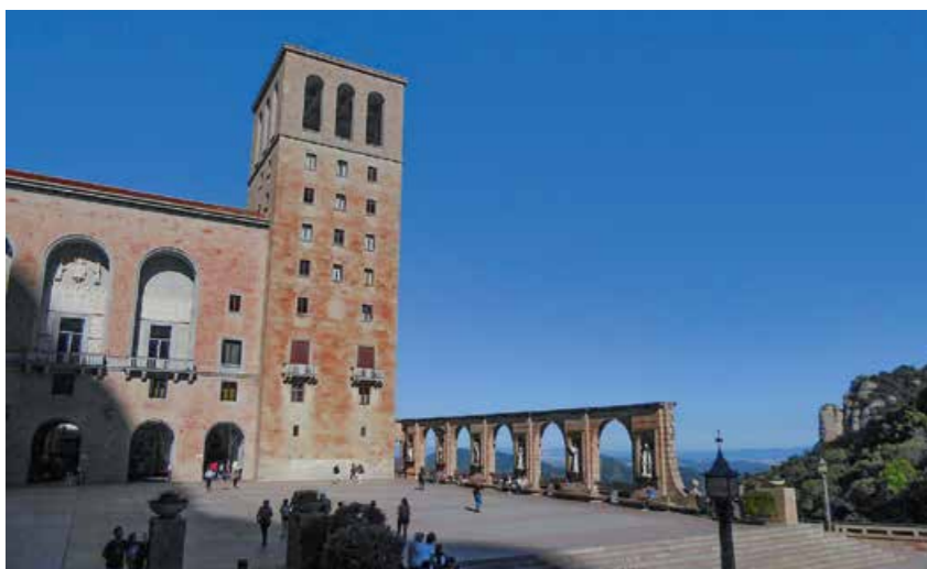
Die Abtei Montserrat liegt auf 721 Metern Höhe.

Fährmann hierbei geschickt die sanfte Strömung, um seinen Katamaran von einer Uferseite zur anderen strömen zu lassen. Bis zu 5,5 Tonnen (drei Kompaktwagen) kann er maximal aufnehmen, oftmals ist es aber auch Weidevieh der örtlichen Landwirtschaft.