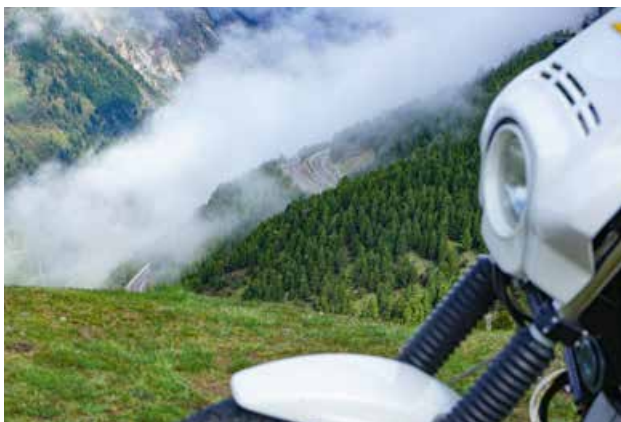
Tiefhängende Wolken im Tal beim Blick vom Port Bonaigua.

Katalonien ist immer eine Reise wert und gerade das Frühjahr und auch der Herbst ist saisonverlängernd für den Motorradfahrer besonders interessant. ◀