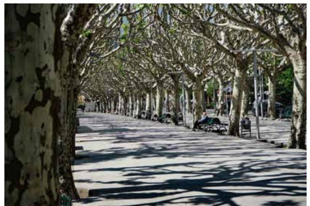
Die Rambla in La Seu d'Urgell.