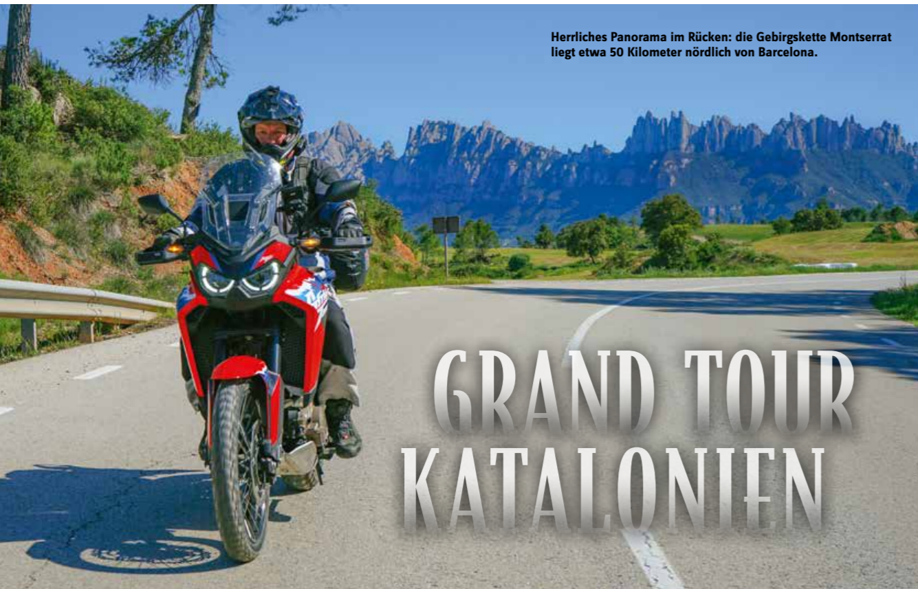
Herrliches Panorama im Rücken: die Gebirgskette Montserrat liegt etwa 50 Kilometer nördlich von Barcelona.