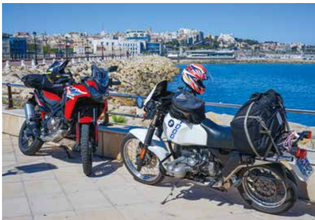
Am Hafen von Tarragona.