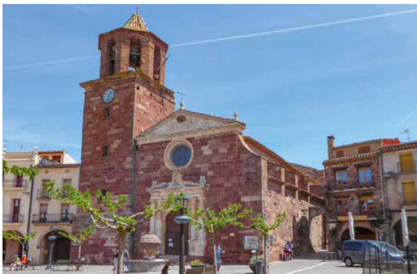
Muy bonita: Die Església de Santa Maria in Prades / Tarragona.

wir den Hut, weil die Angaben für die prozentualen Steigungsraten der Passstraßen ihren Tribut von der Oberschenkelmuskulatur eines Fahrradfahrers einfordern.