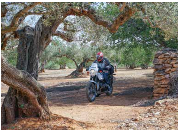
Olivenhaine mit altem Baumbestand in der Nähe von L'Ampolla.