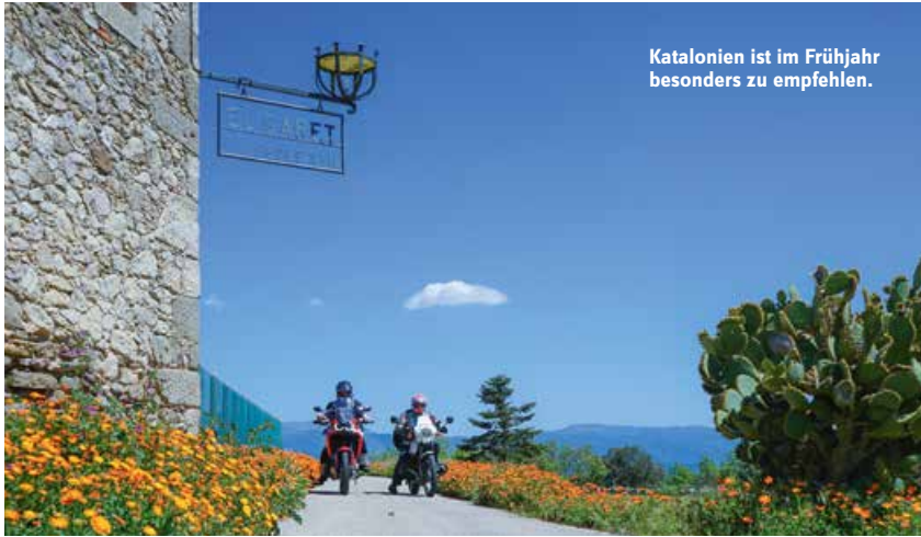
Katalonien ist im Frühjahr besonders zu empfehlen.

unserer „Grand Tour von Katalonien“ knapp 1.500 Kilometer zurückgelegt. Aus Sicht unserer konditionellen Möglichkeiten waren die Tagesetappe sehr entspannt und ließen eine Vielzahl von Pausen und Unterbrechungen zu, die uns die Möglichkeit gab Land und vor allen Dinge Leute kennen zu lernen.