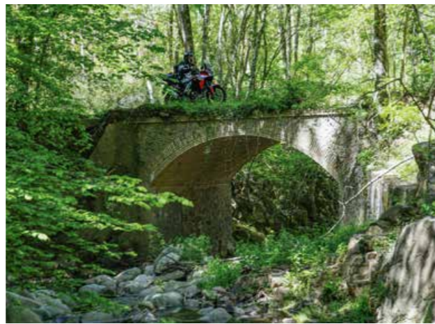
Zahlreiche Brücken, teils mit Natursteinbögen, ziert manche Wegstrecke.

Zahlreiche Brücken, oftmals als Natursteinbögen, zieren unsere Wegstrecke. Wir passieren Sant Martí, dessen Castell Sant Martí de Tous gerade für private Feierlichkeiten vorbereitet wird. Der nahegelegene See, der von zahlreichen Zuflüssen gespeist wird, ist besonders bedeutsam für die Wasserversorgung der Region und der Landwirtschaft.