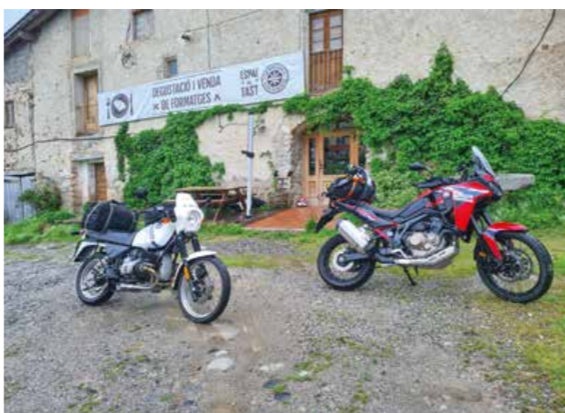
Kulinarischer Stopp bei der Käserei Mas d'Eroles in Adrall.

schendes Getränk und kommen mit einem schweizer/deutschen Paar ins Gespräch, die einen kleinen Teil unserer Etappe mit dem E-Bike bewältigen. Anerkennend ziehen