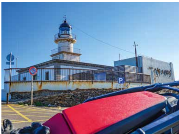
Cap de Creus - der quasi östlichste Punkt Spaniens.