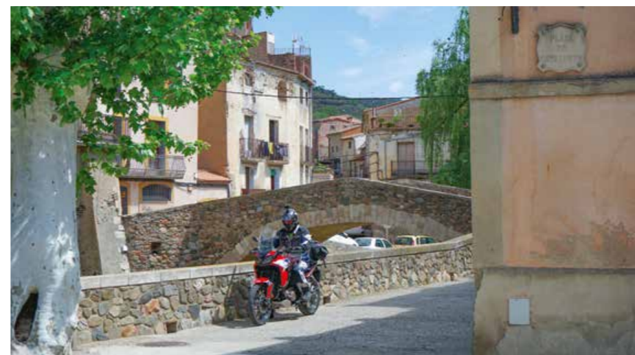
Am Plaça de Catalunya in Porrera.